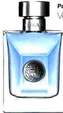
Parfum Versace pour Homme Versace